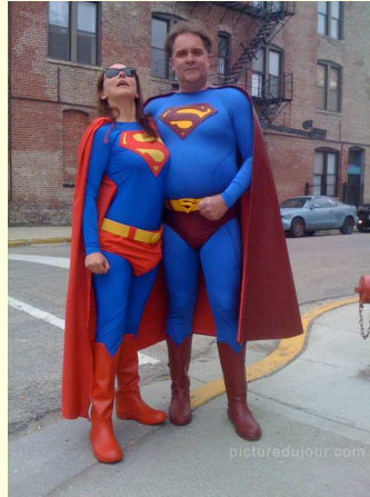
Deutsches Institut für Jugendhilfe und Familienrecht e.V. (DIJuF)